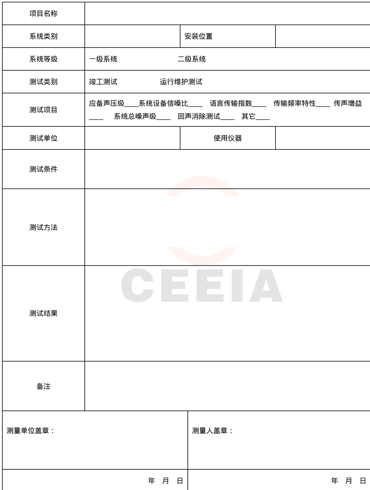
表A.2 中小学校园声学系统工程设备性能测试表